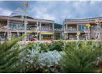
ゆとりすとパークおおとよ

「梶ヶ森スカイライン」の広い道路を標高750mまで一気に上がると、四国山地の山並みと太平洋を見渡せ、正面には四国の水鏡、早明浦ダムが白く光る。 入場口からハウスまでの10段の花壇には、季節の花が迎え、左手には滑り台、キッズアスレチック、トレンがある。ハウスにはレストラン、売店などがある。宿泊できるコテージ、オートキャンプサイトは、早朝の雲海が感動を与えてくれる。 ☎0887-72-0700