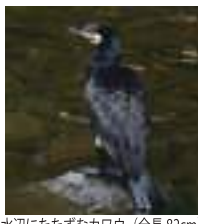
水辺にたたずむカワウ(全長82cm)

今回ご紹介する鳥は、魚を大食することから漁業者に嫌われているカワウです。県内で見られるウの仲間には、カワウ、ウミウ、ヒメウの三種類です。利用されるのは主にウミウです。カワウは明治以前には国内に数多く生息しており、糞を肥料として利用するなど重宝されてきました。しかし一九七十年代には公害による水質汚染などが原因となり全国で5箇所二千羽ほどまで生息数が減少してしまひ、希少な鳥類として手厚く保護された時代もありました。その後「水質汚濁防止法」が施行され、水質が回復すると共に二〇〇〇年には国内で十萬羽まで生息数が回復