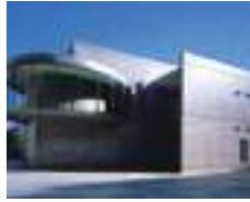
横倉山自然の森博物館

横倉山探索には、この博物館に立ち寄り、事前に概要をつかんでおくこと、実り多い探索ができる建物、登山口の国道から車ですぐのところ。