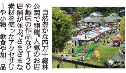
自然豊かな四万十緑林公園で開催。人気のお店や趣味の作品など120店舗が並ぶ。さまざまな素材を使ったアクセサリーや小物、飲食や加工品の出展。演奏会やリラクゼーションなども予定。毎年、子供の日に開催されていて、親子で楽しめるワークショップなどのブースも用意されている。訪れた人が自由に弾ける「森のピアノ」もあり、大人も子どもも楽しめる。