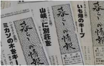
左から創刊号、2号、3号

評を博し、イチゴやイチモのキープも始めた。また、山奥や海辺の空き家を別荘に仕立て、家族で楽しんでもらう企画も途中から県内全市町村め