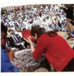
「大杯飲み干し大会」は祭りのメインイベント。太平洋を舞台に酒豪達が集まり、とれたてのどろめ(イワシの稚魚)を着る男性は1升、女性は5合を飲み干し、その時間や飲みっぷりを競う。受付は10時30分から。吹奏楽やお菓子配り、どろめ踊り、午後からは漁船パレードや歌舞伎「白浪五人男」の後、豪快な「大杯飲み干し大会」が始まる。