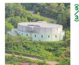
宿毛市総合運動公園を舞台に開かれる。特産品や名物グルメの祭典。