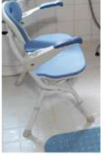
風呂場の椅子は強い味方

があちこち置さなければ。健康力カタログ雑誌やサブリーのDM、チラシが床やテーブルを占領。探し物に苦勞する。5段の棚を4つ買って組み立て、立体的に整理整頓。浴室にも手すり、滑り止めマット、椅子を入れた。電話を掛けてもすぐ出られないので、子機を台付きに買い替えた。